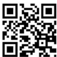
สำรวจ DLTV Nst3

เพื่อให้การดำเนินงานครั้งนี้ได้รับข้อมูลที่ถูกต้อง สำนักงานเขตพื้นที่การศึกษาประถมศึกษา นครศรีธรรมราช เขต ๓ ขอให้โรงเรียนขนาดเล็กในสังกัดดำเนินการกรอกข้อมูลแบบสำรวจความ ต้องการในการซ่อมบำรุงอุปกรณ์รับสัญญาณดาวเทียมและโทรทัศน์ของโรงเรียนที่ได้รับจัดสรรใน ปีงบประมาณ พ.ศ. ๒๕๕๗ ทั้งนี้ ให้ทุกโรงเรียนเข้าไป กรอกข้อมูลระบบออนไลน์ที่ URL เว็บไซต์ www.dlit.ac.th/dltv๕๗ หรือ QR Code